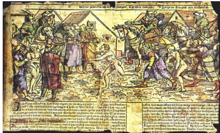
4. Turecký vojak odvádza zajatcov do otroctva obrázok Hansa Guldena. Zdroj: https://www.google.com/search?q=török+ranszolgák/